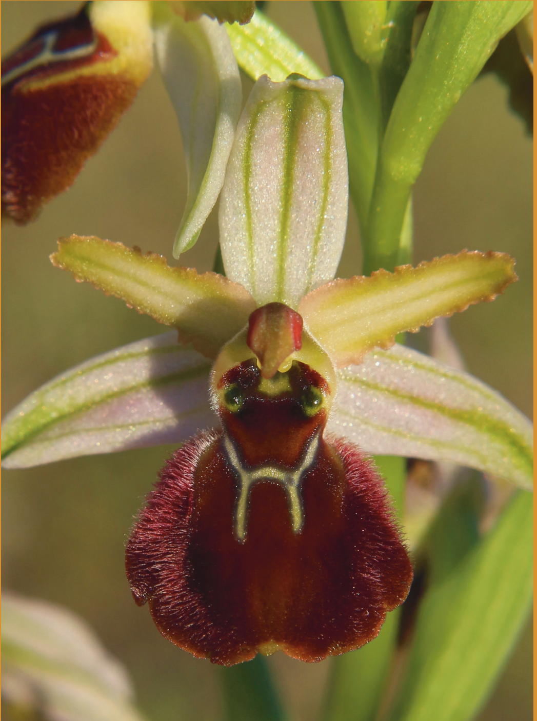
Ophrys panormitana , Nardò (LE), 2.3.2021.