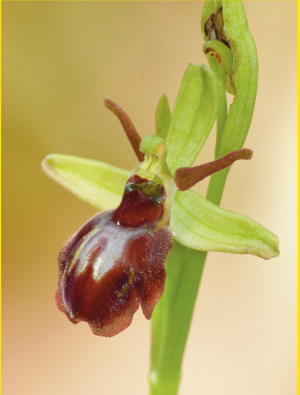
Ophrys × barbieriarum , Cicaletto, Fiesole (FI), 1.4.2021